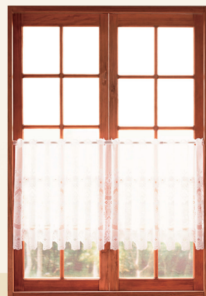
リフォームで、暮らしをもっと素敵に。

返済プランのご紹介 (ボーナス返済なしの場合) / ●年利3.9%の場合 ●以下はご返済の目安であり、借入日等により返済回数・最終返済額が増減することがございます。