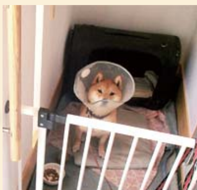
お気に入りのマットを寢床にする エリザベスカラーのポンちゃん。