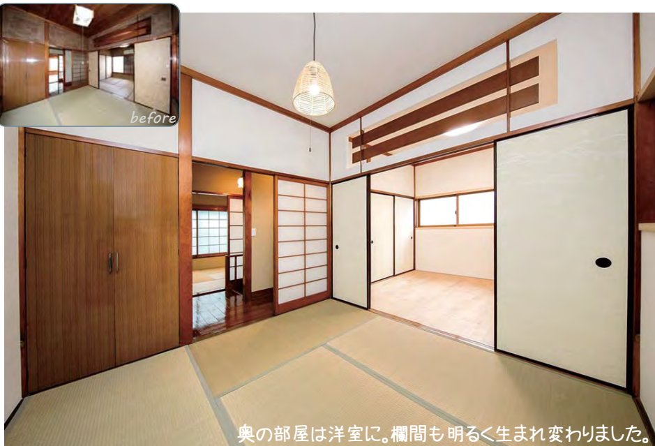
奥の部屋は洋室に。欄間も明るく生まれ変わりました。