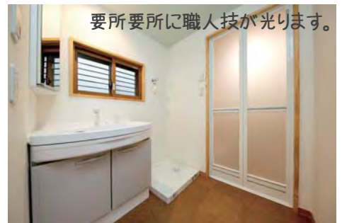
要所要所に職人技が光ります。