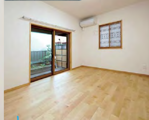
建具職人のおじい様が造られたという素敵な建具も、ピタリ収めました。