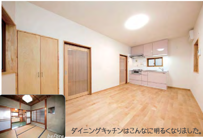
ダイニングキッチンはこんなに明るくなりました。

元の雰囲気を残すリフォームは、すっかり作り替えてしまうより難易度が高いのです。ベテラン職人さんたちの力で実現したリフォーム完成の様子をご覧ください。