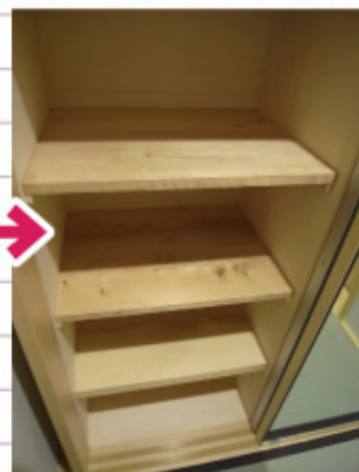
リフォーム前の床板