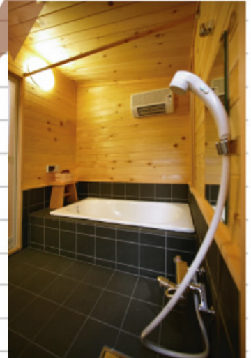
浴室暖房乾燥機も完備されています。

壁一面には、「青森ヒバの板」を張り、腰下部分は少し大きめのタイル張りで仕上げています。ヒバの香りがいっぱいのこちらの浴室は、なんとも壮大で居心地のいい、癒しの空間です