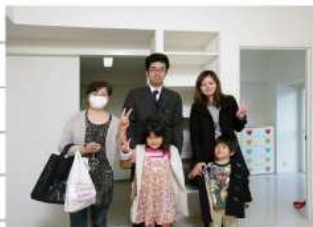
A様、ありがとうございました!

ももとは、A様の奥様のご実家であり、現在はA様ご夫妻がお二人のお子様とお住まいのマンションです。落ち着いた雰囲気のお住まいでしたが、建築されてから既に28年が経過している為、内装や設備は老朽化が進んでいました。この度のリフォームで新築のようなマンション空間に大変身