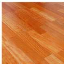
無垢フローリング