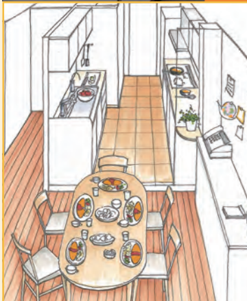
▲スムーズな動線を実現 ▼セミオープンなL型キッチン