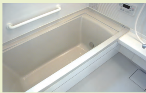
▼足を伸ばせるゆったり浴槽

▲墨田区・K様 マンション ホーロー浴槽のシステムバスを採用しました。シックなブラックの浴槽は肌触りがよく、お湯も冷めにくいと好評です。