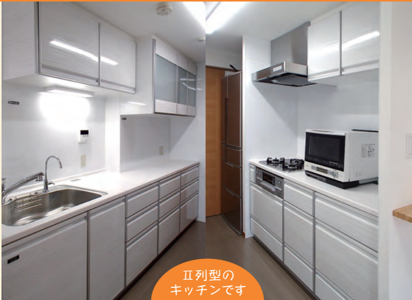
II列型のキッチンです