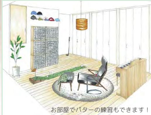
お部屋でパターの練習もできます！