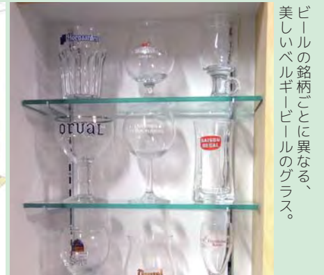
美しいベルギービールのグラス。