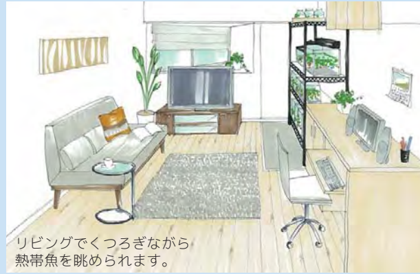
リビングでくつろぎながら熱帯魚を眺められます。

ベタは闘魚とも呼ばれ、縄張り意識が強いんだとか。赤や青など目の覚めるような鮮やかな色が特徴です。