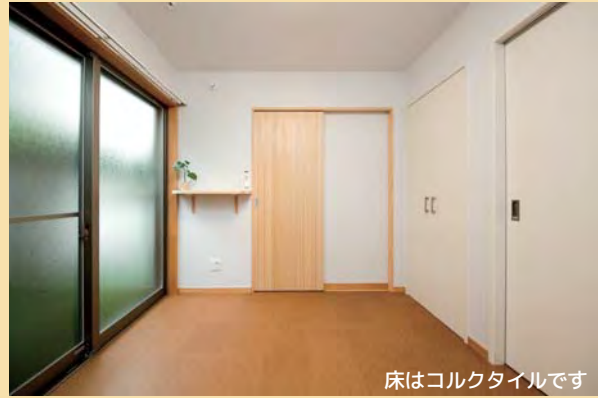
床はコルクタイルです

南側の窓から光と風が入るお部屋です。お部屋から水まわりまでずっと段差なしのバリアフリーで安心です。