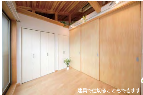
建具で仕切ることができます