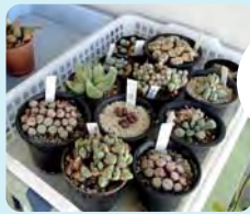
ご主人様が育てている多肉植物。

ウッドパネルが映えるステキなベランダです。ご主人様が育てている植物に水やりできるよう、水栓もついています。