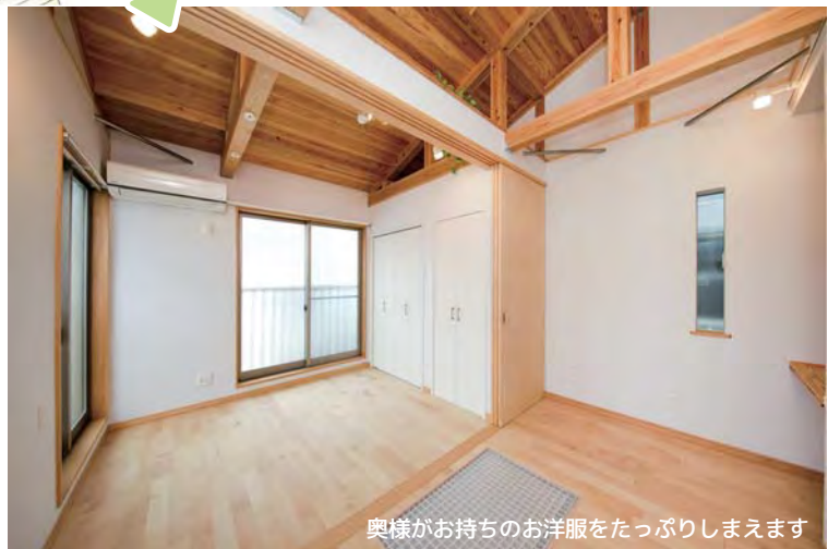
奥様がお持ちのお洋服をたっぷりしまえます