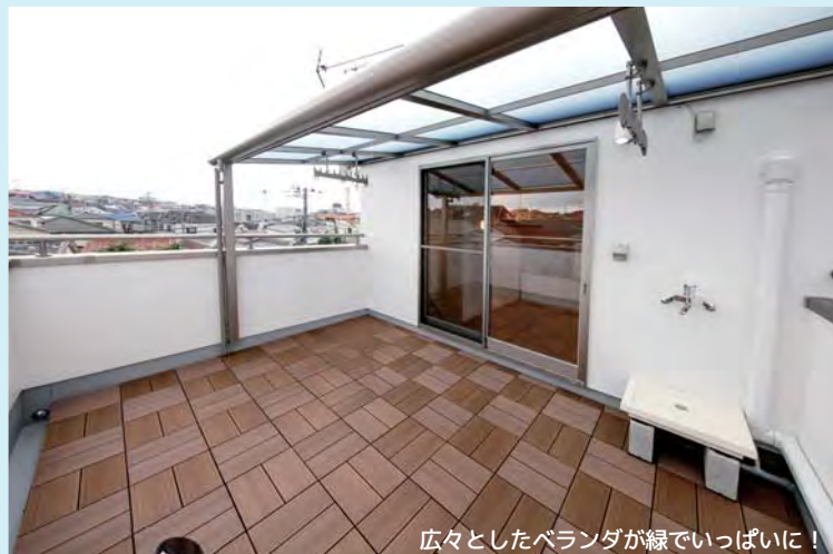
広々としたベランダが緑でいっぱい！