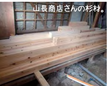
山長商店さんの杉材。