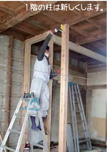
1階の柱は新しくします。

既存の丸い柱のまわりも、職人さんの腕の見せ所。上がり框も丁寧に仕上げてくれました。