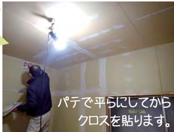
パテで平らにしてからクロスを貼ります。

玄関のタイルは、斜めになっているところが、タイル職人さんこだわりの仕上げです。綺麗に納まっています。