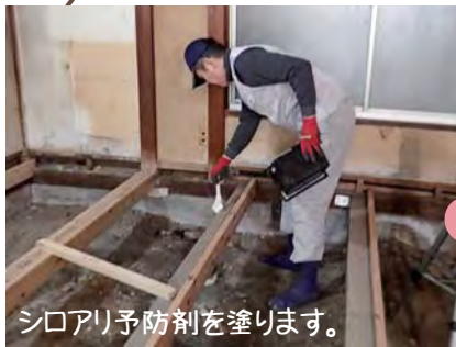
シロアリ予防剤を塗ります。