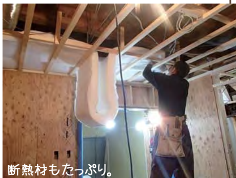
断熱材もたっぷり。