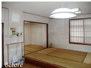
▲ リノベーション前は2つの和室に分かれていました。