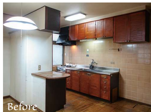
▲ キッチンが壁付けで、ダイニングに背中を向ける形です。

大きな和のリビングの中央には、ご要望の掘りごたつを設置します。畳1枚分のゆったりサイズで、家族みんなでくつろげます。脚への負担も少なくて済みますね。