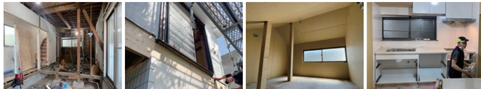
1階部分をスケルトン状態にして状態をチェック。ベランダを撤去したところは構造用合板で補強しました。ロフトの壁と天井に断熱材を入れ、ボードで閉じました。壁にキッチンパネルを張り、新しいキッチンにも交換します。